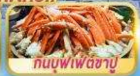
กนบุฟเฟต์ซาบู