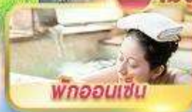
พทอนเซ็น