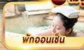
พักออนเซ็น