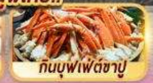
กินบุฟเฟ่ต์ซาปู