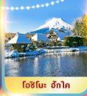
โอะชิโนะ ฮักโค