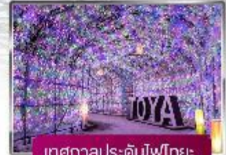
เทศกาลประดับไฟไทย