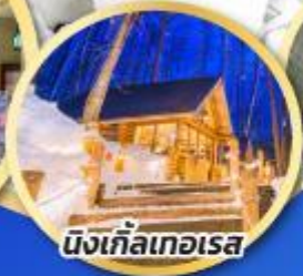
นิงเกิ้ลเทอเรส