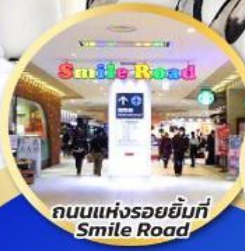
ถนนแห่งรอยยิ้มที่ Smile Road