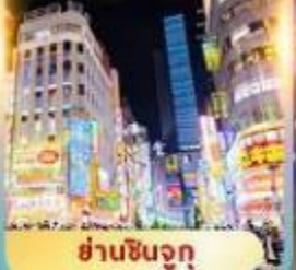
ย่านชินจูกุ