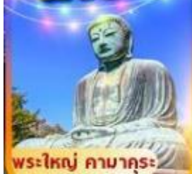
พระใหญ่ คามาคุระ