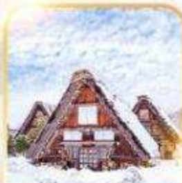
หมู่บ้านอิระคาว่าโกะ

โอซาก้า นาโกย่า เกียวโต ฮิระฮอบบิง 1 วันเต็ม