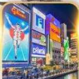
ชินโซบาชิ