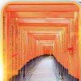
ฟูชิมิ อินาริ