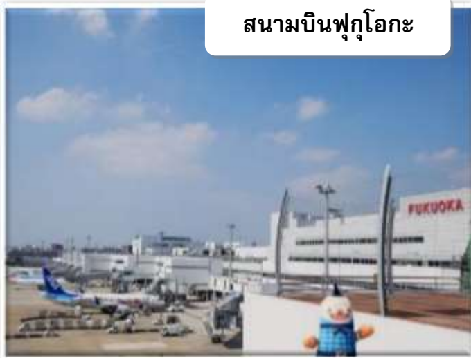
สนามบินฟุกุโอกะ

บริการอาหารร้อนบนเครื่องพร้อมกับเมนูผลไม้สดเพื่อเติมเต็มความพิเศษไปพร้อมๆกับความสดชื่น