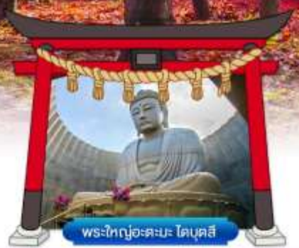
พระใหญ่อะตะมะ ไคบุตสึ