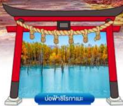
บ่อฟาชิไรมาเอะ