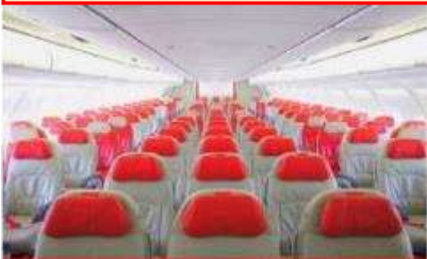
เครื่องบินลำใหญ่ 377 ที่นั่ง

ตัวเครื่องบินเป็นตัวกรู๊ปสำหรับคณะทัวร์ ระบบของสายการบินจะทำการแรนดอมที่นั่ง ซึ่งไม่สามารถเลือกหรือเลือกกระบุนั่งได้ หากลูกค้าต้องการเลือกกระบุนั่ง ทางสายการบินมีบริการอัปเกรดที่นั่ง (ค่าบริการเป็นไปตามที่สายการบินกำหนด)