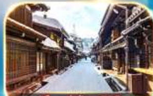
เมืองเก่าชินมาชิซูจิ