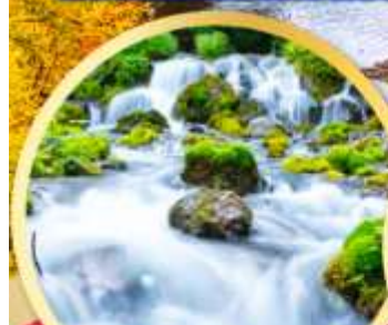
สัมผัสน้ำแร่ธรรมชาติ ณ สวนฟูทาคาชิ