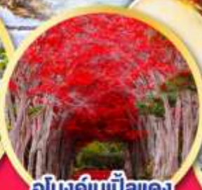
อุโมงค์ไม้แป้นแดง