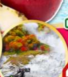
หุบเขานรกจโถกุดามิ