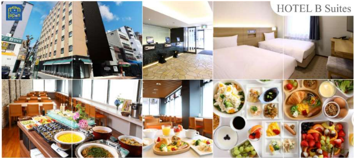
HOTEL B Suites

วันที่สาม เมืองโอซาก้า – เมืองเกียวโต – ศาลเจ้าเฮอัน – การเรียนพิธีชงชาญี่ปุ่น – ศาลเจ้าฟูชิมิอินาริ – เมืองโอซาก้า – LALAPORT & MITSUI OUTLET PARK OSAKA KADOMA