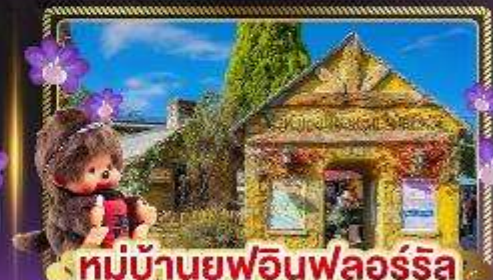
หมู่บ้านยูฟูอินฟลอร์ริล