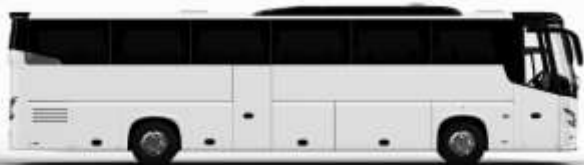
ตัวอย่างรถโดยสาร 1 ชั้น

ค่าที่พักตามที่ระบุในรายการหรือเทียบเท่าระดับเดียวกัน (พักห้องละ 2 ท่าน) หากประเภทห้องที่ท่านริเวลาเข้ามาเดิม อาทิ เช่น 5 เควสห้องพักเป็น TWIN BED หรือ DOUBLE BED ทางบริษัทขอสงวนสิทธิ์ในการปรับประเภทห้องพัก เป็นตามที่โรงแรมมีอยู่ โดยไม่ต้องแจ้งให้ทราบล่วงหน้า