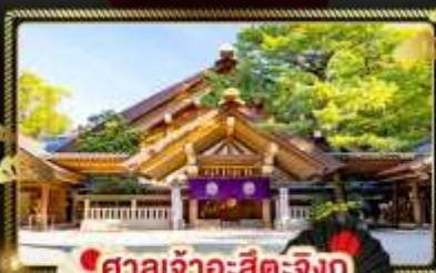
ศาลเจ้าอะสึตะจิงกู