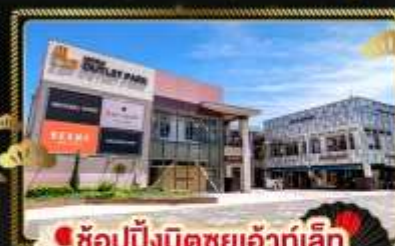
ช้อปปิ้งมิดชูเอ้าท์เล็ท