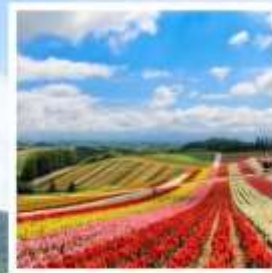
สวนดอกไม้ชิชิโกะโนะโอกะ