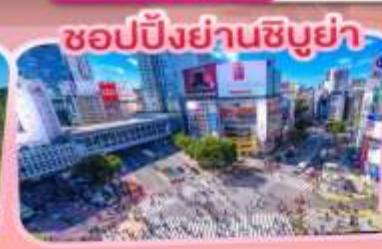
ช้อปปิ้งย่านชิบูย่า