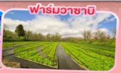
ฟาร์มวาซาบิ