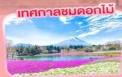
เทศกาลชมดอกไม้