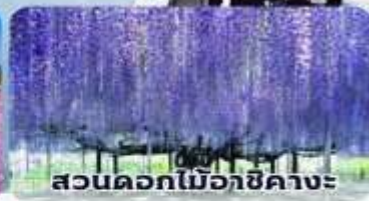
สวนดอกไม้เอจิคาเงะ