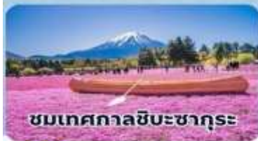
ชมเทศกาลชิบะซากุระ