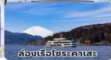
ล่องเรือไซระคาเสะ