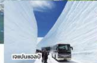
เจแปนแอลป์