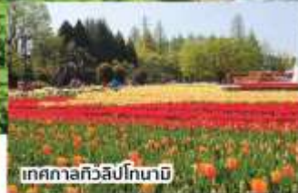
เทศกาลทิวลิปโทนาบิ