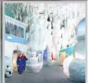
"KAMIKAWA ICE PAVILLION"