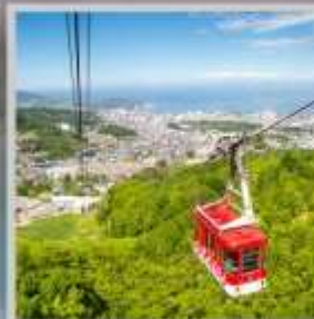
"MT. TENGU ROPEWAY"