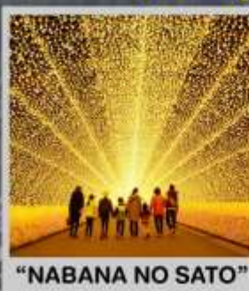
"NABANA NO SATO"