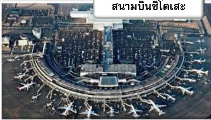
สนามบินชิโตเสะ

เวลา 23.45 น. ออกเดินทางสู่ สนามบินชิโตเสะ ฮอกไกโด ประเทศญี่ปุ่น โดยสายการบินไทย เที่ยวบินที่ TG 670