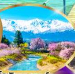
โอฮิเดะ พาร์ค