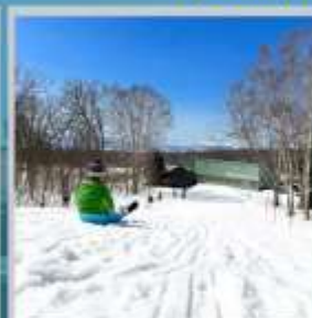
"NISEKO SKI RESORT"