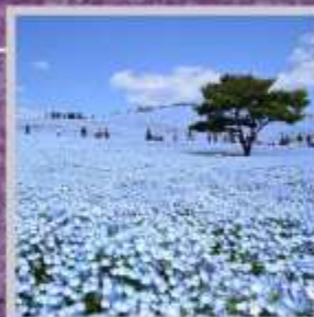
"HITACHI SEASIDE PARK"