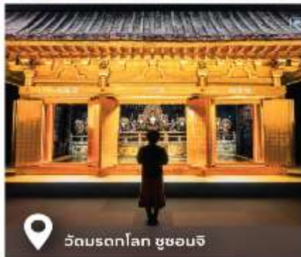
วัดมรดกโลก ชูซอนจิ