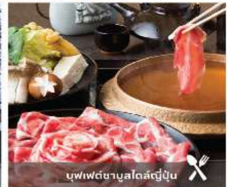
บุฟเฟ่ต์ชาบูสโลว์ญี่ปุ่น