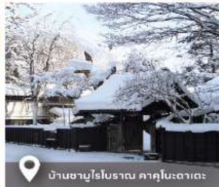
บ้านชาบูโรโบราณ คาคุโนะดาดะ