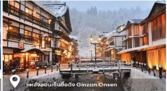
แหล่งออนเซ็นชื่อดัง Ginzan Onsen