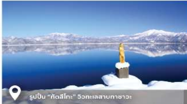
รูปปั้น "กัตสึโทะ" วัตะทะเลสาบคาซาวะ

ใบอนุญาตเลขที่ 21/00928 www.torfuntour.com, torfun_tour@hotmail.com