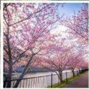
เทศกาลคาวาซุ ซากุระ