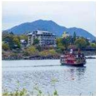
ล่องเรืออปปะระ