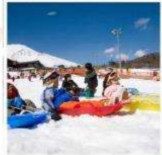
ลานสกีเยติ