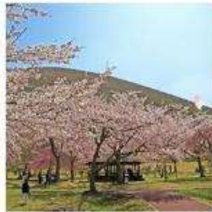
ซากุระ โนะ ซาโตะ