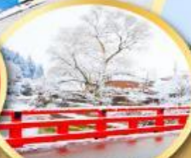
สะพานนากะบาชิ