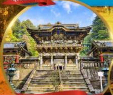
ศาลเจ้านิกโกโทโกโช