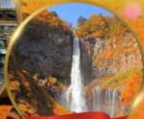
น้ำตกเคกอน