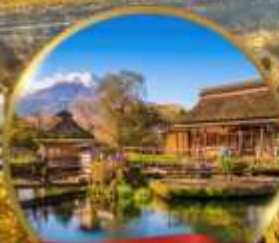
หมู่บ้านไอชิโนะฮะโกะ