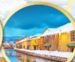
คลองไอศูร