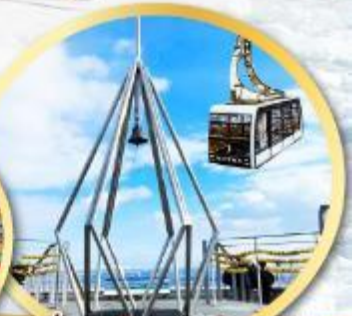
นั่งกระเช้าชมวิวเมืองซัปโปโร MT:MOIWA