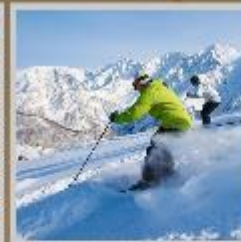
"HAKUBA SKI RESORT"