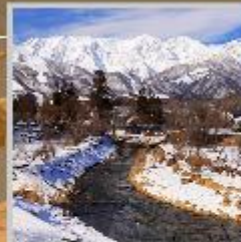
"HAKUBA OIDE PARK"