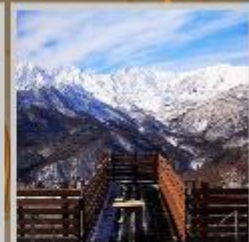
"HAKUBA MOUNTAIN HARBOR"

**ราคาทัวร์ดังกล่าวรวมค่าธรรมเนียมที่พักแล้ว