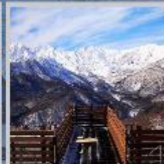
"HAKUBA MOUNTAIN HARBOR"