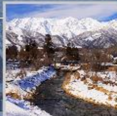
"HAKUBA OIDE PARK"