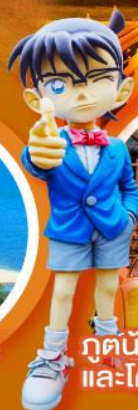
กตน้อย คิตาโร่ และโคนัน