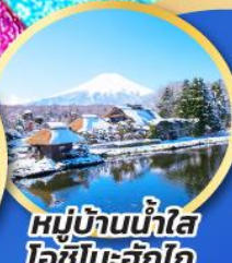
หมู่บ้านน้ำใส ไอชิโนะฮักโกะ