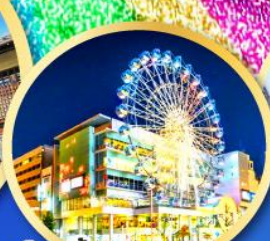
ช้อปปิ้งย่านซากาเอะ