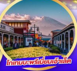
โทเทมบะ-พรีเมียมเฮ้าส์