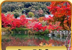
วัดเออิทังโด