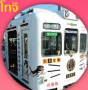
นั่งรถไฟทามะ