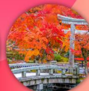
วัดเออิกันโด