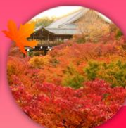
วัดโทฟุคุจิ