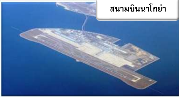
สนามบินนาโกย่า

เวลา 00.05 น. ออกเดินทางสู่ สนามบินนาโกย่า ประเทศญี่ปุ่น โดยสายการบินไทยแอร์เวย์ เที่ยวบินที่ TG 644