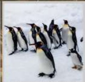
"PENGUIN ASAHIYAMA ZOO"