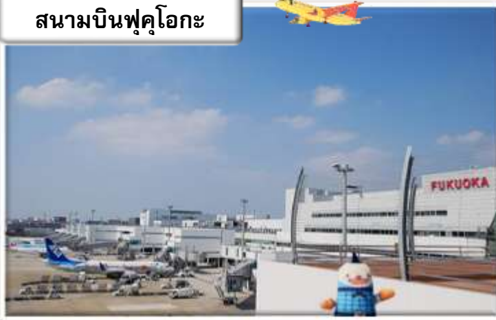
สนามบินฟุคุโอกะ

เวลา 00.55 น. ออกเดินทางสู่ สนามบินฟุคุโอกะ ประเทศ ญี่ปุ่น โดย สายการบินไทย เที่ยวบินที่ T5648