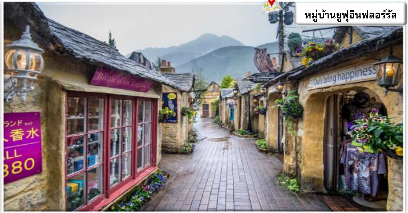
หมู่บ้านยูฟูอินฟลอรัล

เดินทางสู่ ยูฟูอิน (Yufuin) เป็นเมืองชนบทเล็ก ๆ ที่มีทิวทัศน์ที่สวยงามมากโดยเฉพาะช่วงฤดูใบไม้ผลิที่จะมีทั้งดอกซากุระบนต้นไม้ และดอกเรปซีป ที่พื้นด้านล่าง พร้อมกับแม่น้ำ และภูเขา อีสระเดินชม หมู่บ้านยูฟูอินฟลอรัล เป็นหมู่บ้านจำลองสไตล์ยุโรป มีกลิ่นอายยุโรปโบราณ ไฮไลท์ ประจำเมืองยูฟูอิน บ้านอิฐที่แสนคลาสสิกเรียงรายอยู่บนถนนสายเล็ก ๆ ประดับประดาไปด้วยดอกไม้หลากชนิด