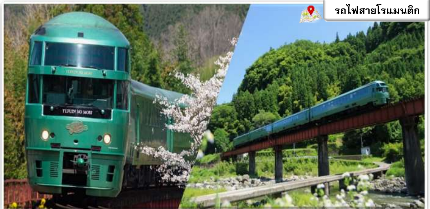
รถไฟสายโรแมนติก