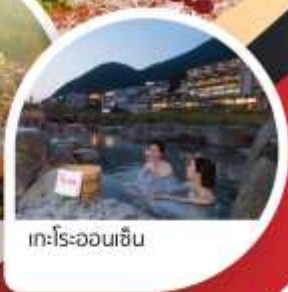
ทะเลร้อนเซ็น

Wifi on bus บริการน้ำดื่ม 10 คน ออกเดินทาง