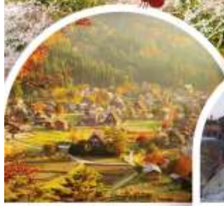
หมู่บ้านฮิราคาว่าโกะ (ฮิรายามา)