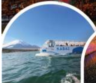
รถสะเทินน้ำสะเทินบก