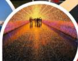
สวนประดับไฟ นาบานาโนะซาโตะ