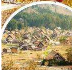
หมู่บ้านฮิราคาว่าโกะ