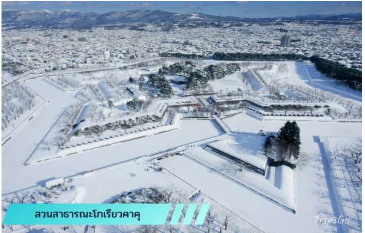
สวนสาธารณะโกเรียวกาคู