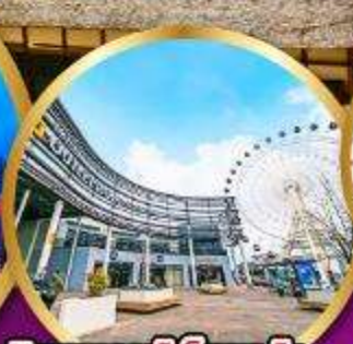
มิตซูเอากะที่เล็ดพาร์ค เซนได