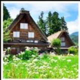
หมู่บ้านชิราคาวาโกะ