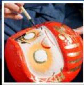
โรงงานตุ๊กตาดารุมะ