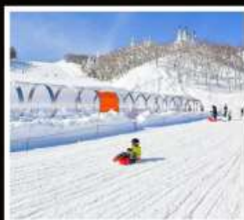
ลานสกี กาล่า ยูซาวะ