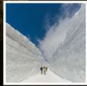
กำแพงหิมะ เจแปนแอลป์