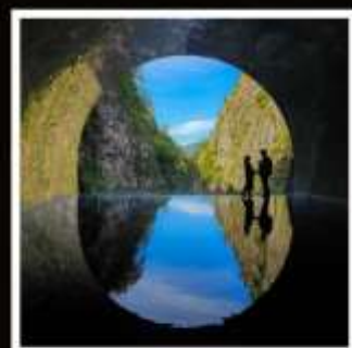
หุบเขาคิโยสึ

เปิดประสบการณ์ใหม่กับฮิปโปบัส ล่องเรือสะเก็นน้ำสะเก็นบกกกลางกรุงโตเกียว!!