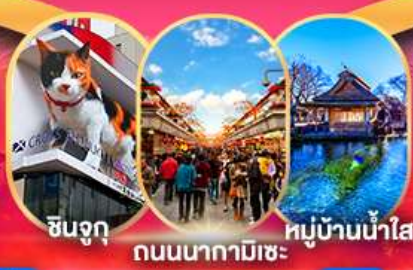
ชินจูกุ ถนนนากามิเซะ หมู่บ้านน้ำใส

วัดอาซากุสะ ถนนนากามิเซะ โตเกียว สกายทรี โอโดมะ โดเวอร์ซิตี ล่องเรืออุทยานฮาโกเน่ โอชิโนะฮักโก เจคิซุเรโต พิพิธภัณฑ์แผ่นดินไหว