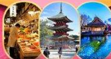
ตลาดปลาสึกิจิ

พระใหญ่คามาคูระ คุุซงาโฮวาคุดานิ โกเทมบะ เอากัสเซ โอชิโอะฮักโก เจดีย์แดงซุระโตะ พิพิธภัณฑสถานญี่ปุ่น ซึบงปิงซันจุกุ ตลาดปลาสึกิจิ สวนอุเอโนะ วัดอาซากุสะ ถนนนากามิยะ ผ่านชมโตเกียวสกายทรี วัดนาริตะชิน อีออนมอลล์