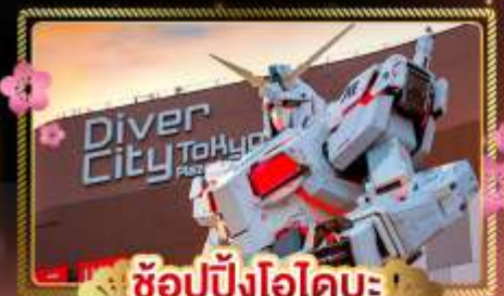
ช้อปปิ้งไอโดบะ