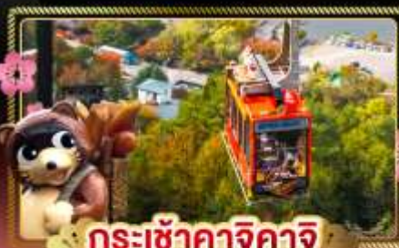
กระเช้าคาจิคาจิ