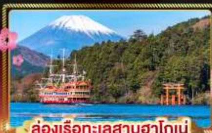
ล่องเรือทะเลสาบฮาโกเน่