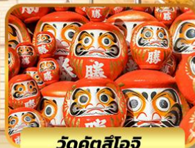
วัดคิตสึโองิ