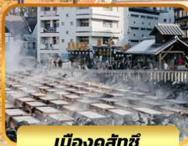
เมืองคุสัทซึ