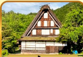
หมู่บ้านพื้นเมืองฮิดะ